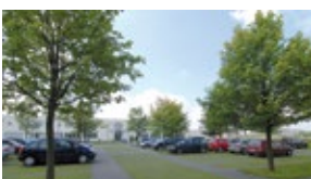
Viel Grün und viele Parkplätze

EIN KLEINER AUSZUG AUS DER FOTOGALERIE – DAMIT SIE SICH EIN ERSTES BILD MACHEN KÖNNEN.